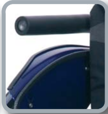
Protector de ropa B82 + tubo