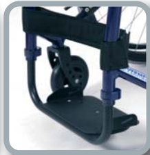
Reposapiés monobloc con chapa de aluminio