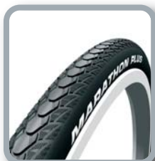
Schwalbe Marathon Plus Evolution