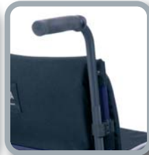
Empuñaduras regulables en altura