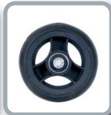
Ruedas 4" negras