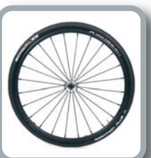
Ruedas 24" Spinergy