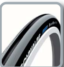
Schwalbe Right Run