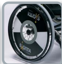
Protector para radios B85 logo Sagitta