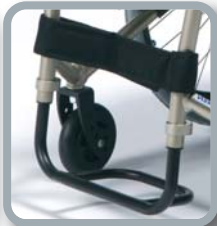
Reposapiés monobloc de tubo redondo