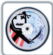
Protector para radios B85 M4 "Pirata"