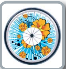
Protector para radios B85 M2 "Flores"