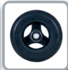
Ruedas 5" negras