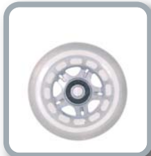
Ruedas 3" translúcidas