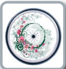
Protector para radios B85 M1 "Flores"