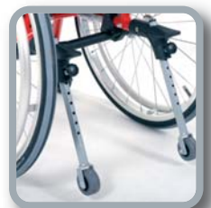
B78 - Posibilidad de montar un sistema de protección antivuelco