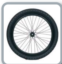
Ruedas 24" Off Road