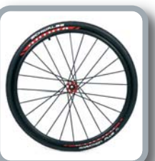
Ruedas 24" Viking