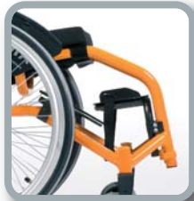
Reposapiés con placa de aluminio (kids)