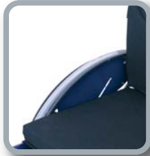
Protector de ropa B82S