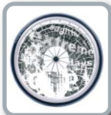
Protector para radios B85 M3 "Extremo"