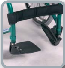
Reposapiés con paletas separadas