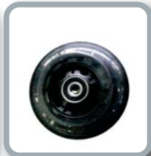
Ruedas 3" negras