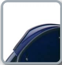
Protector de ropa B82