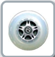
Ruedas 4" translúcidas