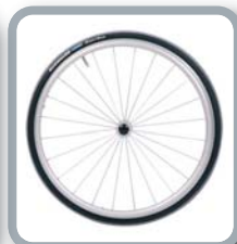
Protector para radios B85 (transparente)