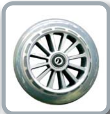
Ruedas 5" translúcidas