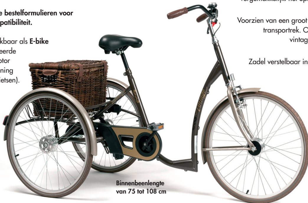
Binnenbeenlengte van 75 tot 108 cm

Tevens beschikbaar als E-bike (een geïntegreerde elektrische motor die ondersteuning geeft bij het fietsen).