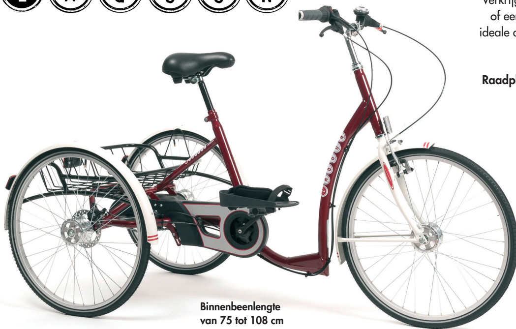
Binnenbeenlengte van 75 tot 108 cm

LAGOON - Volwassenen driewieler Verkrijgbaar in een klassiek bordeaux of een meer neutraal grijs. Dit is een ideale driewieler voor lange afstanden door zijn comfort en stabiliteit.